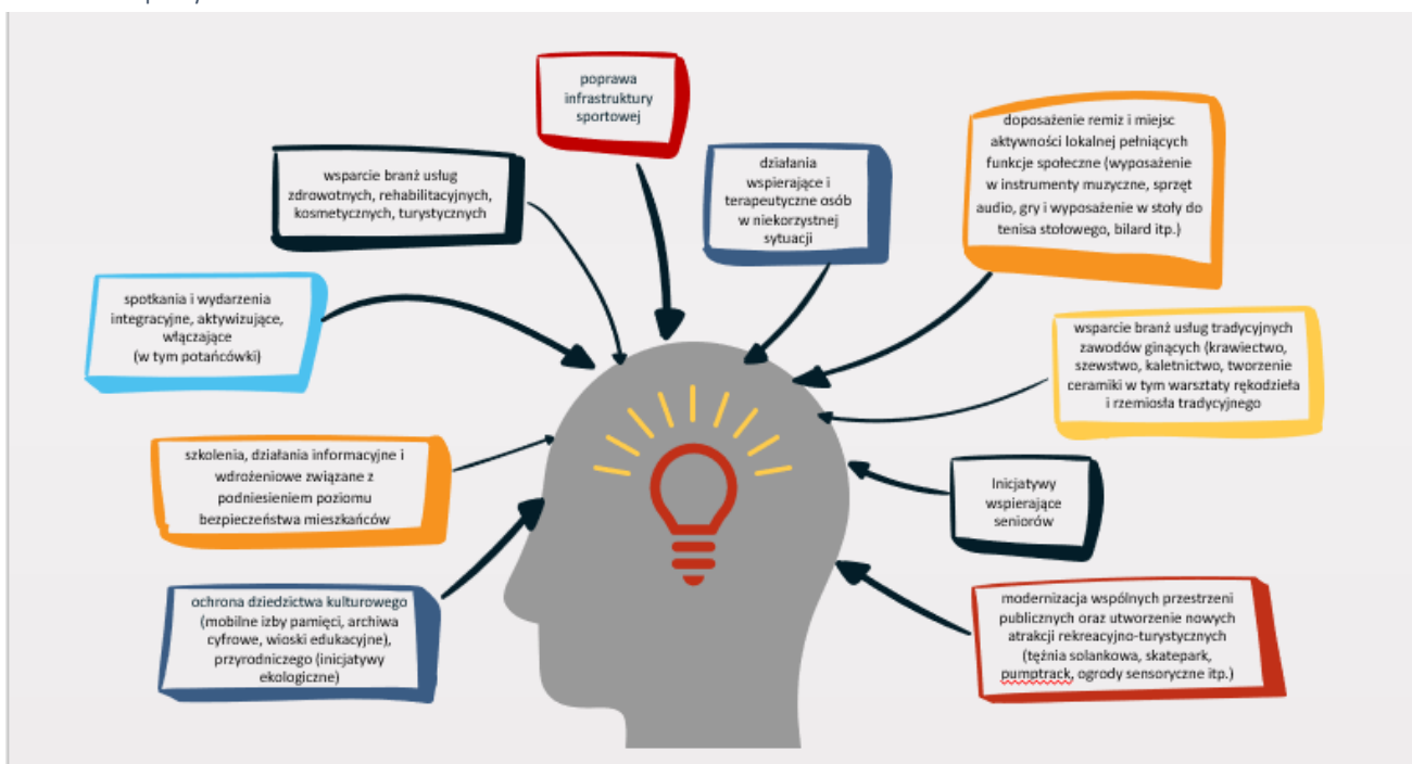
Rysunek 2 Bank pomysłów

Spośród zgłoszonych propozycji prawie 40% zostało ocenionych jako innowacyjne (wprowadzenie nowego lub istotnie ulepszonych produktu/usługi), wpływające na przeciwdziałanie niekorzystnym sytuacjom demograficznym (37%), związane z cyfryzacją (15%) oraz wpływające na zapobieganie zmianom klimatu (13%).